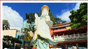
เจ้าแม่กวนอิมรัฟส์เบย์