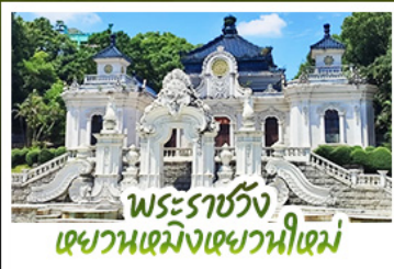
พระราชวัง เฉวานเหมิงเฉวานหนี่เหม่