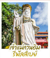
เจ้าแม่กวนอิม รัฟัสส์เบย์