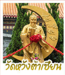
วัดเว้งต้าเซียน