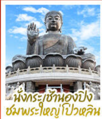
นั่งกระเช้ามองปิง ชมพระใหญ่ไผ่หลิน

นั่งกระเช้ามองปิงสักการะพระใหญ่ไผ่หลิน • วัดหวังต้าเซียน ขอพรสุขภาพ ความรัก วัดเข่งหมิว ขอพรองค์เซกุง โชคลาภ การเงินและธุรกิจ • เจ้าแม่กวนอิมรัฟัสส์เบย์ รับพลังงานดี เสริมพลังฮวงจุ้ย • วัดหมื่นโหมว ขอพรเรื่องการศึกษ การงาน สติปัญญาและความกล้าหาญ