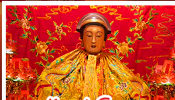
วัดเล่งโง้ว