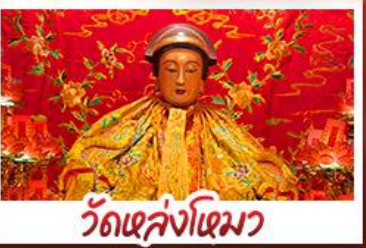
วัดเล่งเน่ยยี่