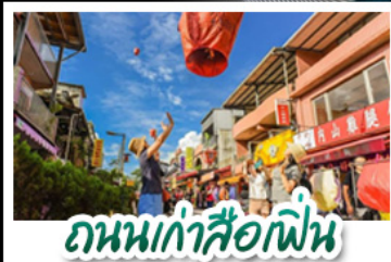
ถนนเก่าลี้อเฟิ่น