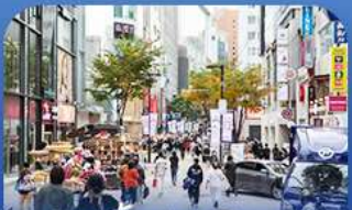
ช้อปบิงข่านเมียงดง