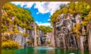
เขตเขาตึกละเมืองโพซอน

ตามหาใบไม้เปลี่ยนสีสุดโรแมนติก ชมวิวแม่น้ำหลายสีจากสะพานแวงรูปตัว Y แห่งเมืองโพซอน สัมผัสความงดงามของโพซอนฮาร์วีย์เลย์ • เติมน้ำมันกลางคืนแปะก๊วยและแม่น้ำโพซอนราชมังคฆ ชมหมู่บ้านฉิมอกกลางบรรยากาศอันชอุ่ม และปิดท้ายด้วยหมู่ทิวทัศน์สอง ณ สวนอานีส และศูนย์ถ่ายทอดนิยามของกรุงโซล ในช่วงฤดูใบไม้เปลี่ยนสีที่สวยงามที่สุด