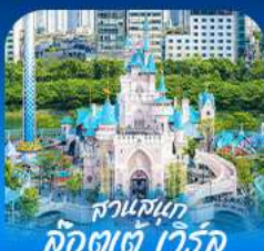
สวนสนุก คังจินเจ็ท เวิร์ด