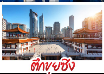
ตึกยูนีซิ่ง