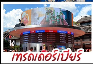
เทรดเดอร์เบียร์