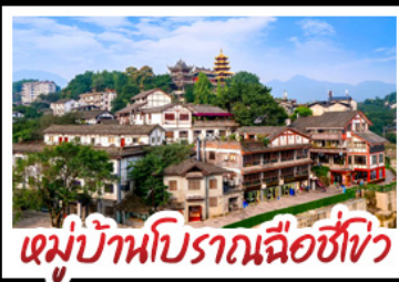
หมู่บ้านโบราณฉือชี่โจว

พระแกะสลักหินต้าจู้ - ตึกตะเกียบ Raffles City - ตึกยูนีซิ่ง เทรดเดอร์เบียร์ - หมู่บ้านโบราณฉือชี่โจว