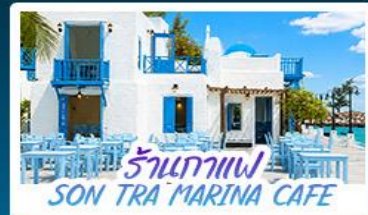
ร้านกาแฟ SON TRA MARINA CAFE