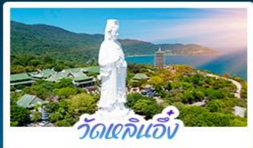
วัดเขคินเอ็ง