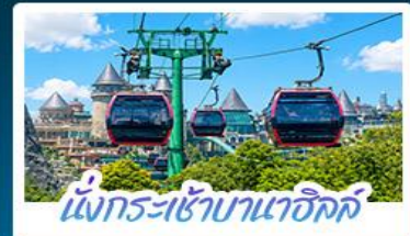
นั่งกระเช้าบานาฮิลล์