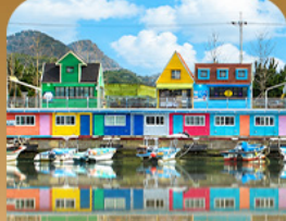
ท่าเรือจังกึม