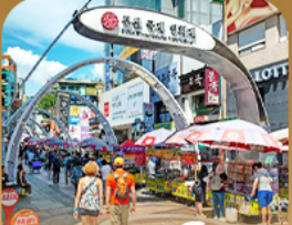
ตลาดนัมโพดง