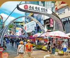
ตลาดนัมโพดง