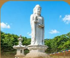
วัดดงฮวาซา

เปิดประสบการณ์เที่ยวเกาหลีสุดคุ้ม 5 วัน 3 คืน เที่ยวสองเมือง • เช็กอินถนนนักร้องคิมควังซอก สัมผัสเสน่ห์ศิลปะและเสียงเพลง • นั่งรถไฟปิ๊งวิวทะเลปูซาน • หมู่บ้านคิมซอนสีล้นสดใส ก่อนเยือนวัดแฮดงยงกุงซาและวัดคยองฮวาซา เสริมความเป็นสิริมงคล • แวะชมท่าเรือสีรุ้ง Bunezia ปิดท้ายด้วยช้อปปิ้งเอาท์เล็ตแดนคัมมาร์เก็ตช็อดัง พร้อมเดินช้อปปิ้ง Walking Street สุดฟิน