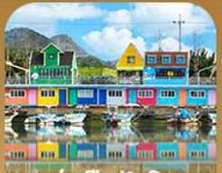
ท่าเรือจ้งนึม