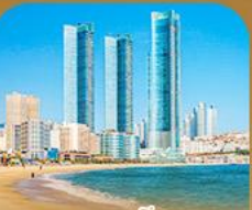
หาดแฮอินแด