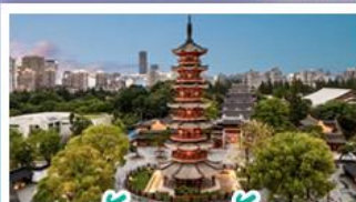
วัดเลงเซ้ง