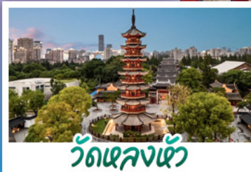
วัดหลงเซ้า