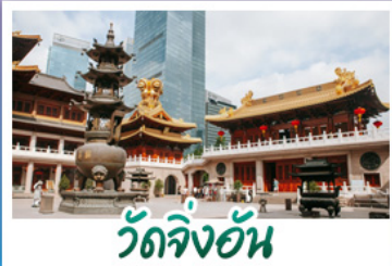
วัดจิ้งอัน

ถนนหอยไ้ - วิวเมืองเชียงไฮ้ - วัดจิ้งอัน วัดพระหยก - วัดหลงหัว