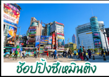
ซูปpingซีเหมินตึง