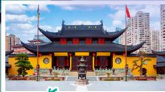
วัดพระหยก