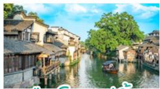
เมืองโบราณอู๋เจิน