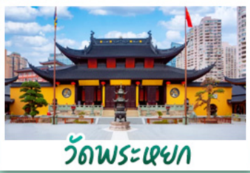
วัดพระหยก