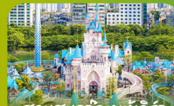
สวนสแกนดิเนเวีย Lotte Adventure World