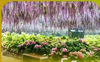
สวนนกเปาเม็ย