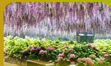
สวนนกเป็ดน้ำ