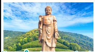
วัดพระใหญ่เฉิงเฉิงซานต้าฝอ