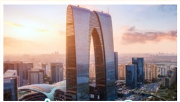
ประตูบูรพาทิส