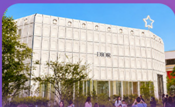
บรู๊กลินเกาเดิ้ล