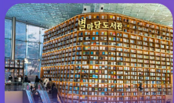
ต่องสมุดสตาร์ฟิลา

เก็บทุกไฮไลท์ ในกรุงโซล ตั้งแต่ความงดงามของ พระราชวังเคียงบ็อก ชมวิวสุดอลังการที่ ดึงลิอเต้ โซลสกาย (รวมค่าลิฟต์ขึ้นดึก) สนุกสุดมันส์ที่ สวนสนุกลิอเต้ เวิร์ล (รวมค่าบัตรเครื่องเล่น) พลิตเพลนไปกับโลกใต้ทะเล ลีอเต้ อควาเรียม (รวมค่าบัตรเข้าชม) เช็กอินแลนด์มาร์กสุดฮิตอย่างห้องสมุดสตาร์ฟิลา โคเอกมอลล์ เดินเล่นย่านฮิป บริกสินทาหลี ซองชุง และช้อปปิ้งซัมเมอร์ชิล สุดฟิน ย่านเมียงดงและฮงแด