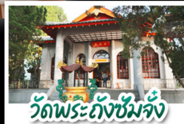
วัดพระถังซัมจั๋ง