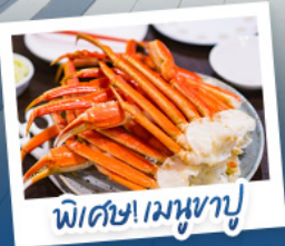
พิเศษ! เมฆหุขานู