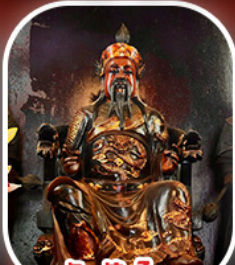
วัดปิกไต้