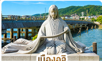
เมืองอูจิ สวรรค์คนรักชาเขียว