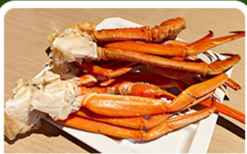
เมนูพิเศษ! ซาปู

เกาะเอโนะชิมะ: วิวสวยงามติด 1 ใน 100 ภูมิภาคญี่ปุ่น พร้อมทิวทัศน์ศาลเจ้าคัคคิสิทธิ์ เที่ยวเต็มถึง 3 วัน แบบจุใจ ทั้งวัด ศาลเจ้า สวนดอกไม้ และช้อปปิ้ง