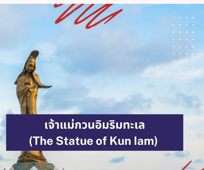
เจ้าแม่กวนอิมริมทะเล (The Statue of Kun lam)