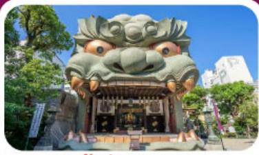
ศาลเจ้านัมมะ ยาชากะ