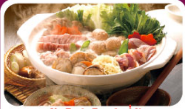
หม้อไฟสไตล์ญี่ปุ่น