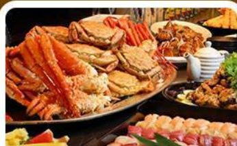
บุฟเฟต์ซาบู+ซาบู 3 ชนิด