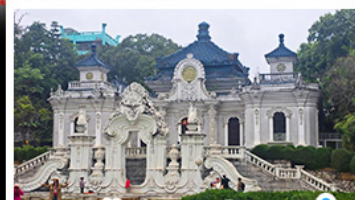
พระราชวังเฉวหนเหมิงเฉวหนี่เหม่