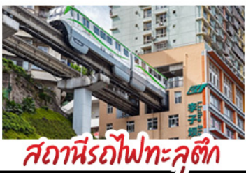
สถานีรถไฟทะเลอูตัก

ฉงชิ่ง - อุ๋หลง - หงหยาดัง อุทยานเทานางฟางซิ่ง สถานีรถไฟทะเลอูตัก หลุมฟ้าสามสะพานสวรรค์