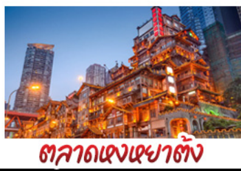
ตลาดแดงเซาตัง