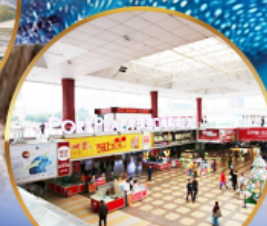
ตลาดกังเป๋ย