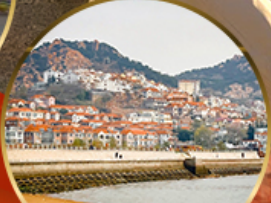
ซาจื่อโข่