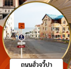
ถนนอ่าวจีป่า