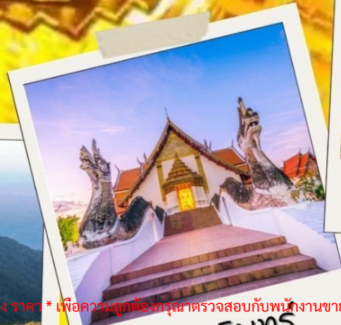
วัดถ้ำมิ่ง