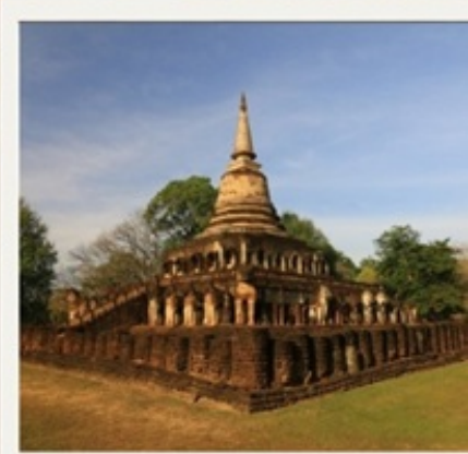
วัดช้างล้อมศรีสัชชาลัย