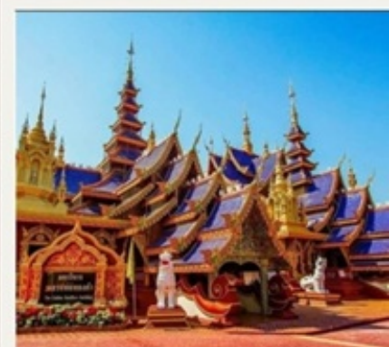
วัดท่าสุพรรณ