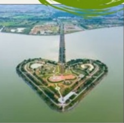
เกาะรูปหัวใจทะเลหลวง

2 ท่านขึ้นไป 11,499 บาท/ท่าน 4 ท่านขึ้นไป 10,899 บาท/ท่าน 6 ท่านขึ้นไป 10,299 บาท/ท่าน