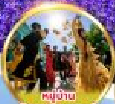
หมู่ชาวมุสลิม

พิเศษ! ตั๋วเครื่องบิน + งบโรงแรมในต่างประเทศ