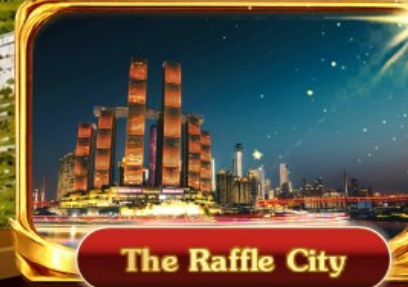
The Raffle City