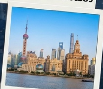
เข็คอินที่เดอะบันด์