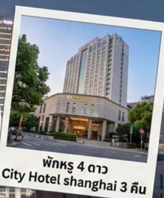
พักรู 4 ดาว City Hotel shanghai 3 คืน

Special Option : ตั้ว Disneyland + รถรับ-ส่ง เริ่มต้นที่ 3,900 บาท/ท่าน