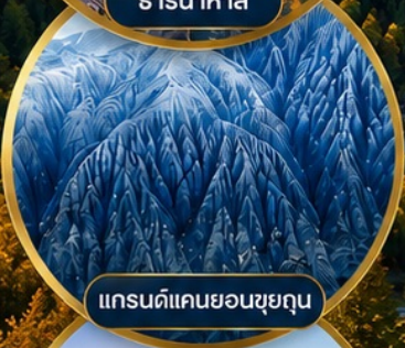
แกรนด์แคนยอนซูยถุน