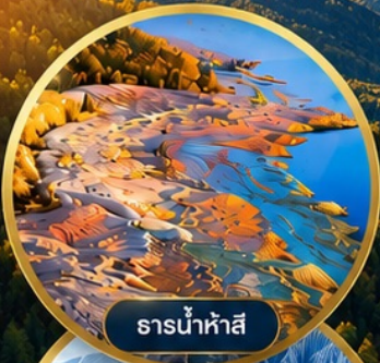
ธารน้ำห้ำสึ