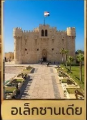
อเล็กซานเดีย