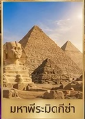
มหาพีระมิดกิซ่า