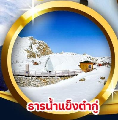
ธารน้ำแข็งต้ากู่