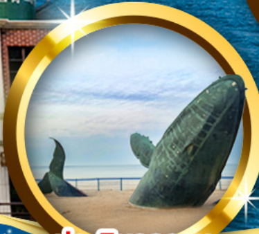
ประติมากรรม วาฬผู้โดดเดี่ยว