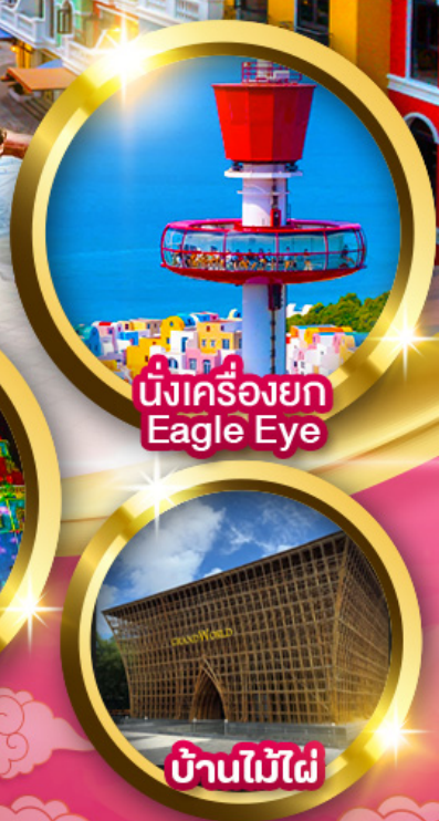
นั่งเครื่องยก Eagle Eye