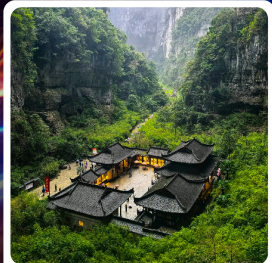
อุทยานแห่งชาติหลุมบ่อฟ้า

ไอโกล์! อุทยานแห่งชาติหลุมบ่อฟ้า มรดกโลกระดับ 5A รถไฟฟ้าทะลุติ๊ก ตึกตะเกียบ อลังการแสงสีหงหยาดัง