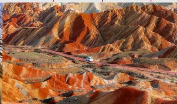
ภูเขาสายรุ้งจางเย่ต้นเสี่ย