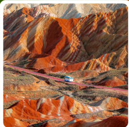
ภูเขาสายรุ้งจากเข้