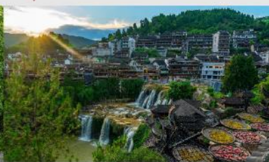
หมู่บ้านโบราณฝูหรงเจิ้น

*ทางบริษัทฯ ขอสงวนสิทธิ์ในการสลับโปรแกรมทัวร์ตามความเหมาะสมขึ้นอยู่กับสถานการณ์หน้างาน โดยคำนึงถึงผลประโยชน์ของลูกค้าเป็นสำคัญ