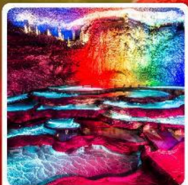
ถ้ำเก้าเทพ

ไฮไลท์! หมู่บ้านชาวนี้อู่ซาง หมู่บ้านโบราณผู่หลงเจิ้น ถ้ำเก้าเทพ ล่องเรือทะเลสาบผิงหู สวนถ้ำสามสหาย