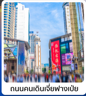
ถนนคนเดินเจี๋ยฟางเป่ย์