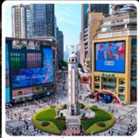
ถนนเจี๋ยฟางเป่ย์

ไฮไลท์! อุทยานแห่งชาติหลุมพืด้า มรดกโลกระดับ 5A รถไฟฟ้าทะลุตึก หงหยาดัง ตึกตะเกียบ ถนนเจี๋ยฟางเป่ย์