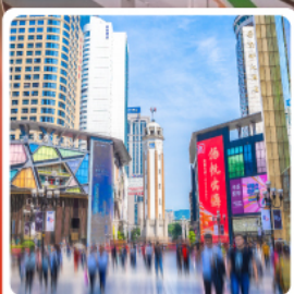
ถนนคนเดินเจี่ยฟางเป่ย์