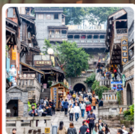
ถนนคนเดินสี่อ่าเก๋