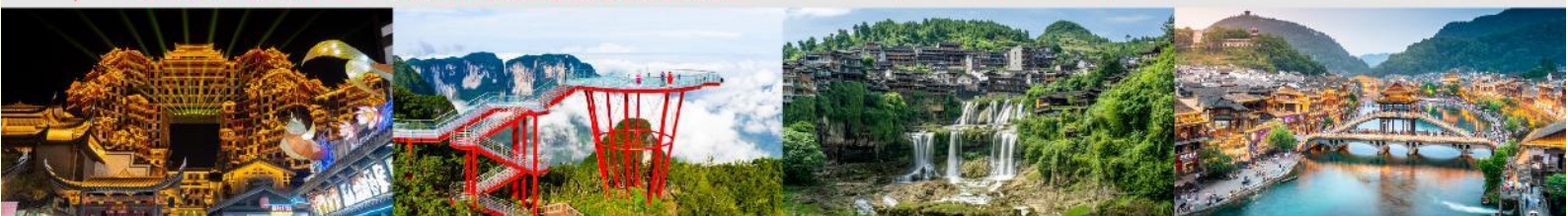
ตีทมส์ควอร์รี่ 72