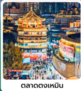
ตลาดตงเหมิน

• โฮเทล OH Bay เป็นแลนด์มาร์คท่องเที่ยวและศูนย์การค้าทันสมัยมีทะเล กวนอูในเซ็นทรัล ชื่นชอบเรื่องการช้อปปิ้ง โชคกลาง บาร์มี ความสำเร็จในการทำงาน