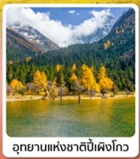
อุทยานแห่งชาติปี้เฟิงโกว