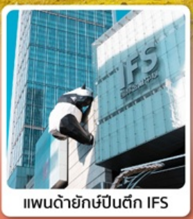
แพนด้ายักษ์ปิ่นตึก IFS

• ไอลาร์ อุทยานแห่งชาติจิวจ้ายโกว ได้ชื่อว่าเป็นสวรรค์บนดิน ภูเขาสี่ดรุณี (หุบเขาของเจียวโกว) เทือกเขาแอลปีแดนมังกร