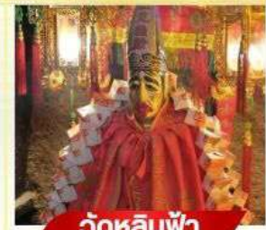
วัดหลิมฟ้า